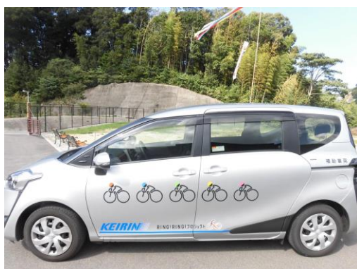
シエンタ 7人乗り 横向き

移送車4 (シエンタ) ( http://hwsa8.gyao.ne.jp/aozora/ )